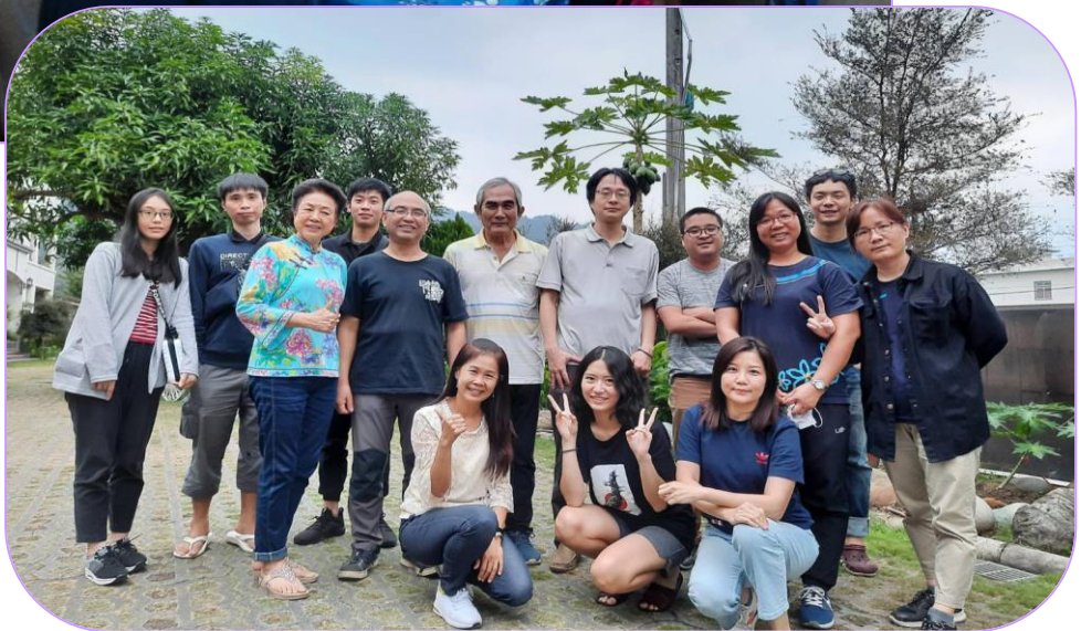
活動地點：美濃中正湖民宿