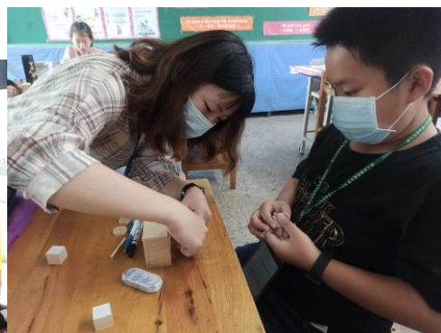
木工課程透過骰子萬年曆，讓學生自行黏貼小盒子並繪製日期，同時學習日期的英語