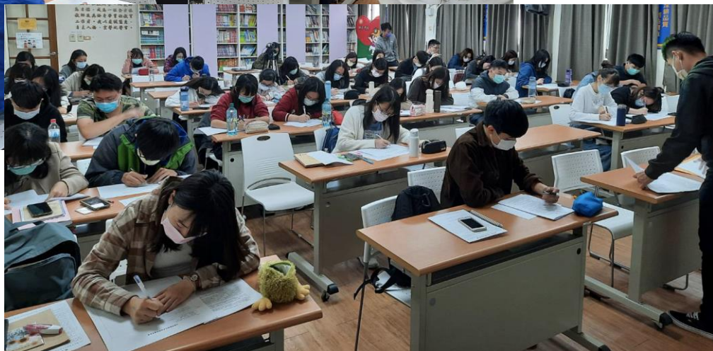
準考生們 振筆疾書