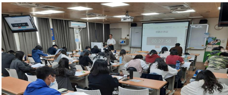
老師於投影片 倒數計時，讓 學生撰寫模擬 試題

工欲善其事，必先利其器。想要戰勝教檢這關，首先要知道自己手上握有何種利器。所謂「器」，除看得見的參考書、考用書、應試文具用品外，更多的是腦海中對於教育知識的累積。在演講過程中，吳教授會隨時抽問並複習許多重點知識，學生透過橫向理論、縱向考題實例，同時輔以歷史事件、社會事件讓學生了解不同理論的源起、發展及應用。筆者坐在台下聆聽，亦認為透過這樣的方式回答，可以讓問答题更加完整，方方面面皆兼顧得到。最後，老師呼籲應試的考生一定要累積足夠的資訊能量，在面對不同題目時，才能以最短的時間擷取自己腦海中有用的資訊快速作答！