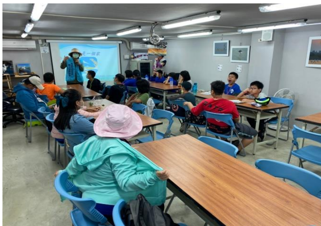
環境教育講座－認識濕地