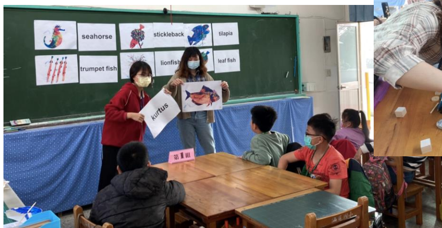
英語會話課，教師以圖卡及單字呈現會話內容，提升學生的學習動機

在夥伴們精心的課程設計下，此次的營隊涵蓋內容豐富，包含：英語歌唱、英語會話、英語單字、英語故事、木工課程、遊戲島嶼、書背詩、音樂律動、營歌帶動唱；同時結合汕尾國小當地特色，大多內容皆與海洋有關。在第三日下午結業式，高師大學生設計闖關活動，藉此進行評量，瞭解學生的學習狀況。筆者在過程中擔任攝影，看得出闖關過程中學生玩得十分投入，從專注的眼神與滿足的笑容便可知孩子們的收穫遠不只手上的禮物，更多的其實是與同儕互動的美好回憶，以及成功挑戰自己的喜悅。