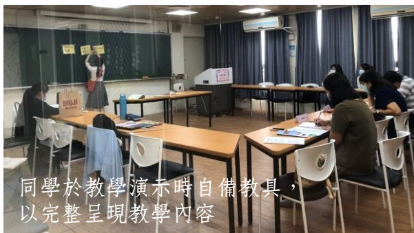
同學於教學演示時自備教具，以完整呈現教學內容

除專業科目的能力表現之外，每位師資師也展現出教學規劃與技巧的運用。一位教音樂的師資生便以活潑生動的授課方式抓住了大家的目光，將課堂引起動機的活動與課堂最後的收尾活動相互呼應，讓在場者清楚了解到這堂課所學習到的內容。這樣的安排獲得在場評審委員的讚賞。此外，也有許多教學上的應用值得師資生們相互學習，並加以轉換為個人教學上的實務能力。