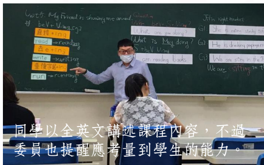
同學以全英文講述課程內容，不過委員也提醒應考量到學生的能力。