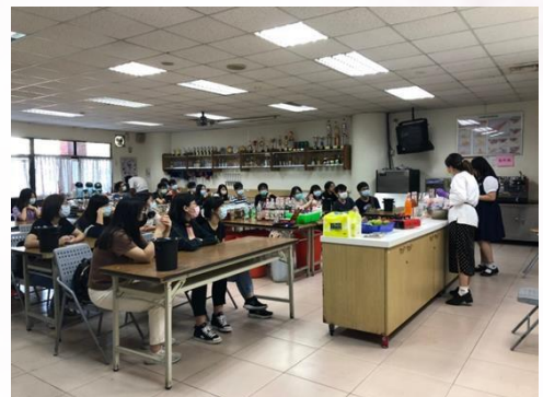
黛葶講師簡述飲調製作過程