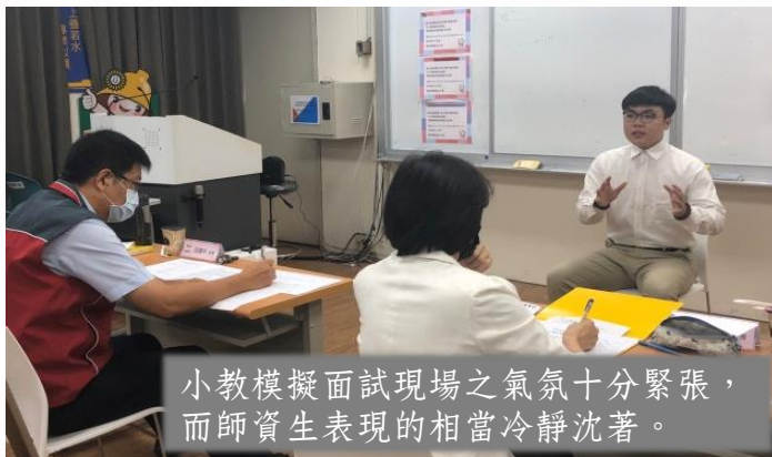
小教模擬面試現場之氣氛十分緊張，而師資生表現的相當冷靜沈著。

在觀摩的過程中，師資生可在當下進行换位思考，面對相同情境，別人是用什麼樣的方式呈現，如果換成是自己，自己又會如何應對。大家能互相學習他人的優點，或是想想有哪些地方能有更好的呈現。最後還能透過現場評委的講評，將專業建議轉換吸收成個人的寶貴經驗，以精進教學實務能力。在這次活動中，相信除了參與模擬試教及模擬面試的師資生獲得許多專業回饋外，觀摩各場演示的師資生也有滿滿的收穫。唯一比較可惜的是，每個場次是同時間於不同場地進行，因此無法參與所有組別的教学演示及面試過程。