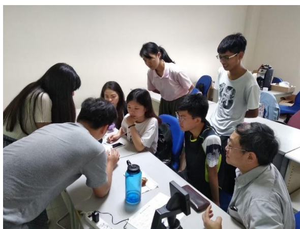
印尼僑生分享印尼人文風俗與生活日常