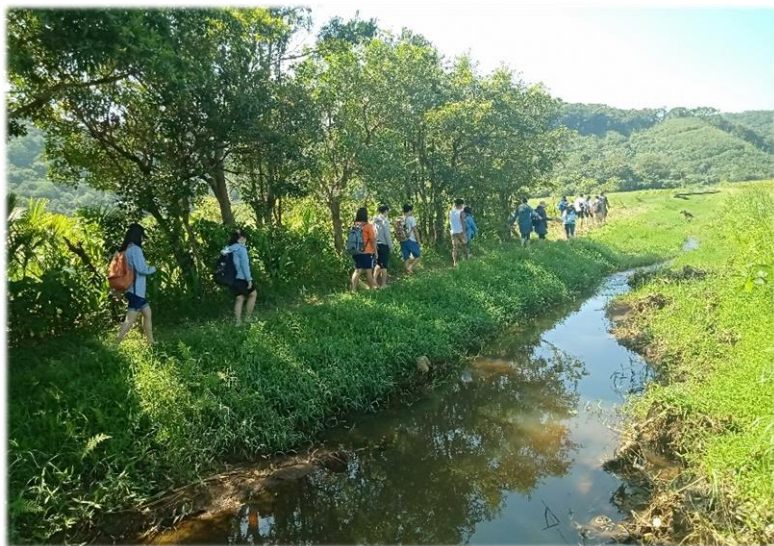
大家赤腳走入水上草原，感受其地形風貌與土壤特徵

隨著導覽族人赤腳走入水上草原，兩側長滿了一大片的野薑花與茅草，上方是草堆層疊，草下是水，踏在軟綿綿的草原上感受到的是自然與人的貼近和心神沁涼、舒暢無比。導覽族人說要夠「幸運」才能整身陷入泥淖，身體被泥淖困得越深，代表接受祖靈的祝福也就越大，但我們一行人各個都是小心翼翼，如履薄冰，牽起彼此的手才不至於跌入泥淖中。走完一輪，最後在族人的帶領下，我們異口同聲地喊著排灣族語：瑪莎露，以感謝祖靈賜予機會，給予我們寬闊的一片草原。我想，水上草原在排灣族人眼中不僅僅是自然景觀，更是排灣族文化中非常重要的一環，從儀式當中也可以體現出排灣族對於大自然的尊敬與愛護，大自然中的一切都與排灣族的生活融合在一起。