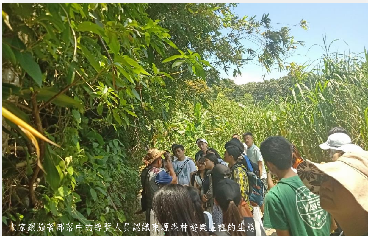
大家跟隨著部落中的導覽人員認識東源森林遊樂區裡的生態

隨著導覽人員的腳步再往前走我們來到了「馨香森林」，這裡有近百棵高聳的桃花心木，樹齡幾乎都超過五十年，而且是世界上珍貴且稀少的樹種，在排灣族人眼中更是具有神聖意義。這片森林裡除了有幾處吊床可以悠閒地躺在上面享受森林與陽光帶來的洗禮，還有許多與大自然融為一體的「環境藝術」。其中最令我印象深刻的是藝術家運用排灣族的傳說故事「生命樹」作為創作的內涵，它的寓意除了表示生命的延續，更在於透過老一輩告誡下一代要重視這得來不易的安居之地與環境資源。藝術家運用了大自然中的石頭、漂流木與麻繩，在樹洞前面製作一條道路，讓前來觀看的人們可以透過這條道路理解東源村的遷村歷史還有尋找生命的根據地，樹洞就代表著每個人心中的那片土地，通道則代表了麻里巴族人生活在這裡的故事，誕生出東源這個得來不易的美麗土地，希望透過藝術讓大家記得每一個重要的歷史。在手作課程中，我更看到了排灣族人藝術與自然結合的智慧，取材自然，以巧手讓原本一顆一顆散落在不同枝條的荸薺變成祈福的吊飾與手飾。大家邊串著吊飾，邊享受著馨香森林的悠閒與寧靜，彷彿時空凝滯般地置身於童話故事中的魔法森林。