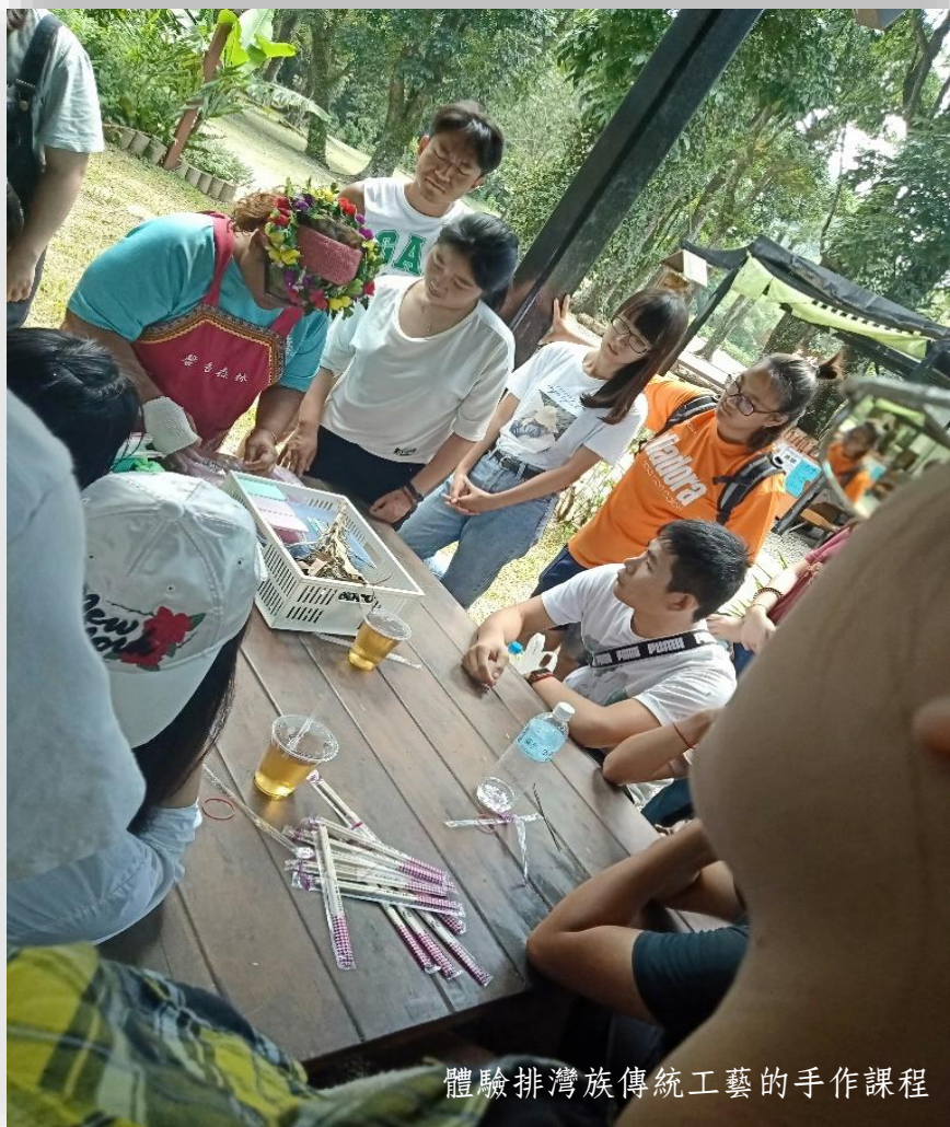
體驗排灣族傳統工藝的手作課程

原住民部落的觀光發展有別於一般觀光，最重要的概念就是族人生活在自己的家鄉，用心經營祖先傳承下來的土地，能兼顧產業發展與環境保護，永續利用各項資源，充分發揮原住民文化與自然和諧相處的生命智慧，而這也是麻里巴部落與東源村居民結合外部民間與學校，還有政府的支持下十分成功的部落觀光產業。人文生態的永續